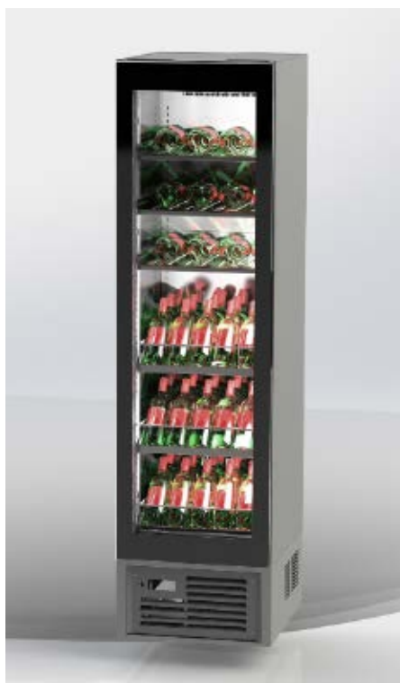
Weinklimaschrank WEKU-IL – steckerfertig mit Sockelverblendung