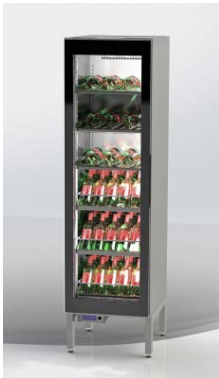
Weinklimaschrank WEKU-IL – zentralgekühlt mit Sockelverblendung